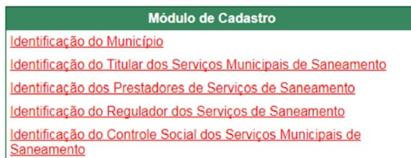
Figura 2 - Módulo de Cadastro do SIMISAB.

O módulo de cadastro objetiva caracterizar o município a partir de dados socioeconômicos, demográficos, referentes à sua localização, e aspectos institucionais dos serviços, como identificação e cadastramento dos prestadores (CARDOSO; MAIA; CARLOS, 2015a), mostrado na Figura 2.